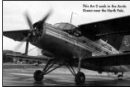
Aus AW&ST May 22/2000

ste sich mit vier anderen Männern aus einer langsam versinkenden Antonov 2 retten. Und zwar nicht irgendwo, sondern eine Meile vom Nordpol entfernt. Die Gruppe Leute war mit zwei Flugzeugen bereits vier Tage zuvor am Nordpol gelandet, kehrte nach Norwegen zurück und wollte auf dem Rückflug in die USA am 15. Mai nochmals einen Zwischenhalt am Nordpol einschalten.