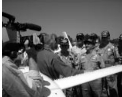
Das Interesse war riesig

Mit dem Logo der Swissair, das habe ich den Verantwortlichen erklärt, werde ich vorläufig keine neue Expedition planen. Ausser es kommt eine Anfrage, verbun- den mit einem konkreten Budgetvor- schlag. Man müsste vielleicht einmal eine Güterabwägung machen: Was bringt eine solche Aktion der Firma, den Piloten, der Fliegerei? Bei meinen Ge- sprächen mit den TV-Anstalten habe ich Zahlen gehört, was meine Medienpubli- zität einer Firma bringen kann, und das lässt sich durchaus in Franken beziffern. Weiter müsste ein Verantwortlicher das Rückgrat haben und sagen: Das ziehen wir durch – und dann voll hinter dem Projekt stehen. Auch der AEROPERS-Vor- stand müsste dann vielleicht bezüglich