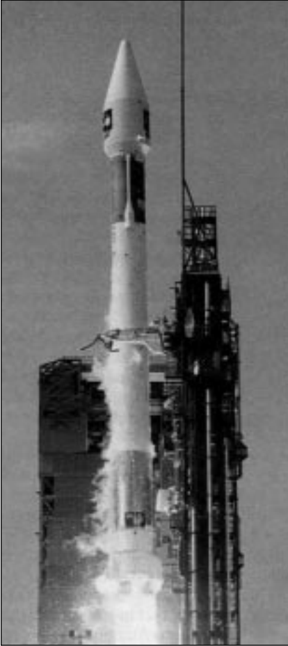
Aus Aw&ST May 29/2000

erstoff/Brennstoffverbrauch der Triebwerke von 2000 kg/sec entspricht. Eine halbe Minute später wurde wieder auf 64% reduziert, damit die Belastung beim Übergang in den Überschallbereich nicht zu gross wurde. Wieder 30 Sekunden später ging's auf 87% hoch und die Leistung wurde ab diesem Zeitpunkt so