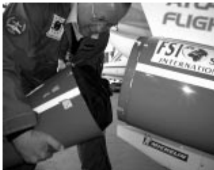
Packen war oft schwierig

Was mich Journalisten aber auch immer wieder gefragt haben ist, wieso keine Firma das Patronat übernommen habe. Beim abgebrochenen Flug der Ju-52 habe man nicht in erster Linie die Piloten, sondern IWC damit in Verbindung gebracht. Beim Breitling Orbiter stand auch die Firma im Vordergrund, wogegen bei mir über eine «Ein-Mann-Show» zu berichten gewesen wäre. Das hat mich natürlich gefreut, aber auch gezeigt, dass ein «Low-budget» Unternehmen für Sponsorenfirmen offenbar doch zu wenig lukrativ ist, obwohl es eindeutig medienwirksam ist.