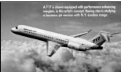
Aus AW&ST June 5/2000

Für Kunden, denen die Boeing 737 Businessjet-Edition zu gross ist, studiert Boeing Modifikationen, wie die 717 (ex-MD-95) zum komfortablen Geschäftsreisejet umgebaut werden könnte. Es geht um das Marktsegment, das Airbus heute mit der A319 und morgen mit der A318 besetzt. Mit einem zusätzlichen Rumpftank soll eine Reichweite von New York nach London ermöglicht werden. Damit aber auch der Absatz der 717 als Passagierflugzeug gesteigert werden kann, sollen auch hier Winglets einerseits den «sales-appeal» erhöhen, andererseits aber auch Leistungen verbessern, damit mehr Flugplätze mit kürzeren Pisten bedient werden können.