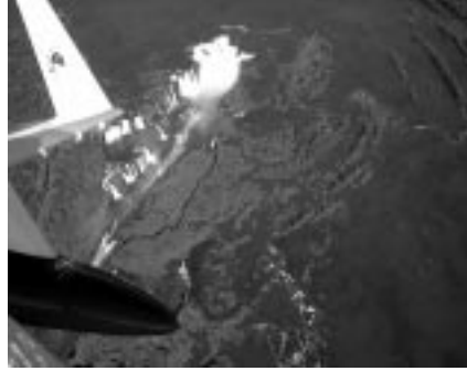
Foz do Iguaçu

Als ich seinerzeit – nach zeit- und nervenaufreibenden Eingaben – endlich die Zusatztanks beim Luftamt durchgebracht hatte, verspürte ich das Bedürfnis, das Flugzeug jetzt auf seine Leistungsgrenzen auszureizen. Und es gab Weltrekorde, die ich in die Schweiz holen wollte. Zuerst war ich auf den Streckenrekord von 7000 Kilometern aus, der ebenfalls von einer Long-Ez gehalten wird. Aber dazu bräuchte ich noch etwa 80 Liter zusätzlichen Treibstoff – also wieder fast unüberwindbare Hürden, das faktische «Nein» des BAZL zu einem «Ja» zu bringen, und im Moment mag ich nicht mehr mit dem Luftamt verhandeln, vielleicht kommt der Rekord aber später doch noch dran.