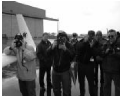
Grosses Interesse beim Abflug

In Afrika ging bei einem Prototypen eines Magneten ein Bestandteil kaputt.