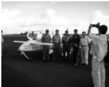
Empfang auf den Osterinseln

bezüglich Weltrekord-Anerkennung und so weiter. Morgen kommt der Aero Kurrier aus Deutschland zu einem ganztägigen Interview, übermorgen besucht mich eine Schulklasse auf dem Flugplatz Grenchen – nach der Aufzeichnung einer Talkshow in Biel, dann muss ich wieder arbeiten – so geht es laufend zu und her. Viel Zeit brauchte ich gleich nach dem Flug, damit ich die rund 160 Weltrekorde offiziell beim FAI registrieren lassen konnte. Dazu musste ich von den verschiedenen Ländern die offiziellen Dokumente anfordern (bis zu neun Formulare pro Landung!), ausfüllen, kopieren, an die richtigen Stellen schicken und nachkontrollieren. Ein paar Unterlagen sind gar nicht angekommen, also werden es etwas weniger Rekorde. Die Wichtigsten sind sicher die Streckenrekorde sowie «Speed around the world – eastbound and westbound».